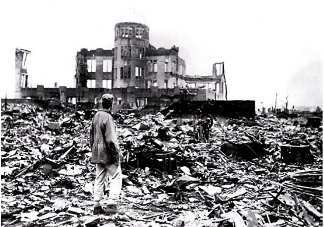
Bomba di Hiroshima, agosto 1945

è importante avere un’associazione per lottare contro le violenze sui civili. Quest’azione è necessaria e difende una grande causa. Purtroppo non riesce ancora a fermare le azioni violenti come la guerra in Ucraina. Mi ricordo, la bomba nucleare di Hiroshima, che è stata spedita dagli Stati Uniti, nel 1945. Ho scelto questa esperienza perché è la bomba più conosciuta, ha distrutto le città intere e ha fatto 70 000 morti. Per impedire le barbarie sui civili si può limitare il numero di bombe in ogni paese, fino a toglierle del tutto. Ma anche trovare accordi per avere la pace nel mondo